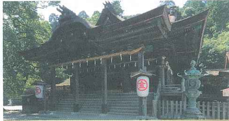
金刀比羅宮 海上安全の守護神「こんぴらさん」