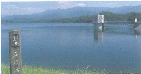
満濃池 全国で最大の農業用ため池