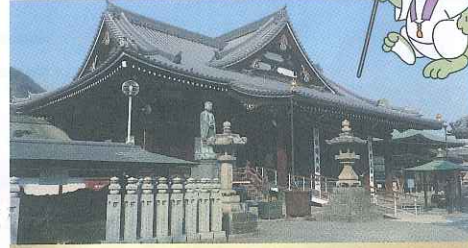
善通寺 空海誕生の地、弘法大師三大霊跡の一つ