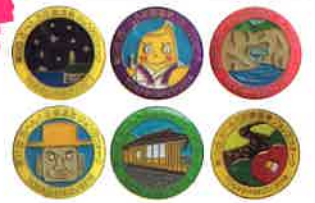
過去のピンバッジデザイン