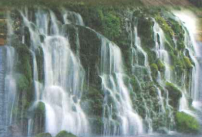
象 瀧 元 滝