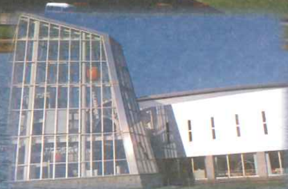
にかほフェアイト子ども科学館