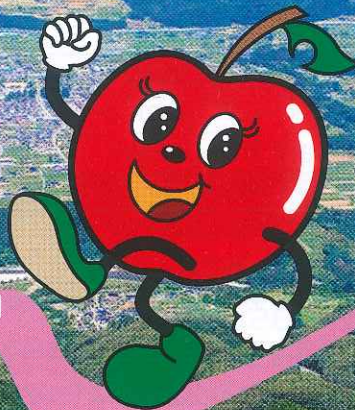
イメージキャラクター 「アップルちゃん」