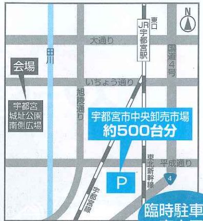
臨時駐車場 案内図