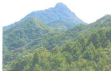
じょうこ岩から望む志々伎山西側尾根

平戸南部の福良漁港公園駐車場に集合。ここから車で上部の志々伎山登山口西側駐車場に移動。ここからトレッキング開始。じょうこ岩まで尾根を木々をかき分けながら進みます。景観や植物を楽しみながらじょうこ岩へ。昼食後、少し下って眺望の良い岩場まで。ここから横に進んで福良まで戻ります。カシワの林がある変化に富んだコースです。