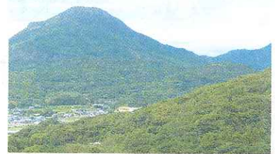
上段の野から屏風岳尾根を見る

平戸南部公民館(多目的研修センター)の駐車場に集合。ここから屏風岳登山口下まで車で移動。ここからトレッキング開始。旧道を早福峠まで植物等を観察しながら歩きます。峠で休憩した後、屏風岳山頂まで尾根を登ります。岩場が多いルートを海やダンギクを眺めながら山頂へ。平戸南部の景観と昼食を楽しんだ後、正規の登山道を下ります。