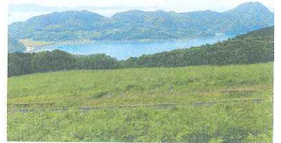
川内峠から眺める古江半島

旧古江分校跡地に集合。ここから人家横を少し登って山道に入り、昔の通学路にもなっていた山道を歩きます。途中、岩場から生月島等を眺めて小富山の麓に出ます。休憩後、仁道(にいど)の海岸へ向かいます。観音岩を見ながら海岸で昼食。午後は西側の海岸林の中を阿波造(あわぞ)まで。ここからまた林に入って分校跡地に戻ります。