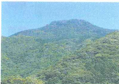
春日から見た安満岳北側

安満岳登山口駐車場に集合。ここからアカガシの原生林と秋の自然を楽しみながら三の鳥居広場まで。ここから石の参道を登って山頂の祠と展望所です。生月島や宇久島等を眺めた後、参道に戻って広場からクリシタン古道を山野まで下ります。昼食後、さらに下ってさばくさらかし岩まで進みます。途中、聖地中江ノ島を眺め、小春日の案内所へ到着。この後、春日の棚田を見学。マイクロバスも使って安満岳へ戻ります。世界遺産を体感できるトレイルコースです。