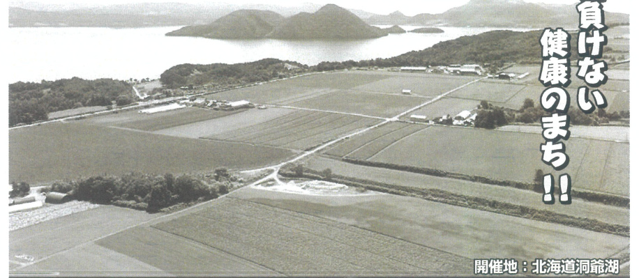
開催地：北海道洞爺湖