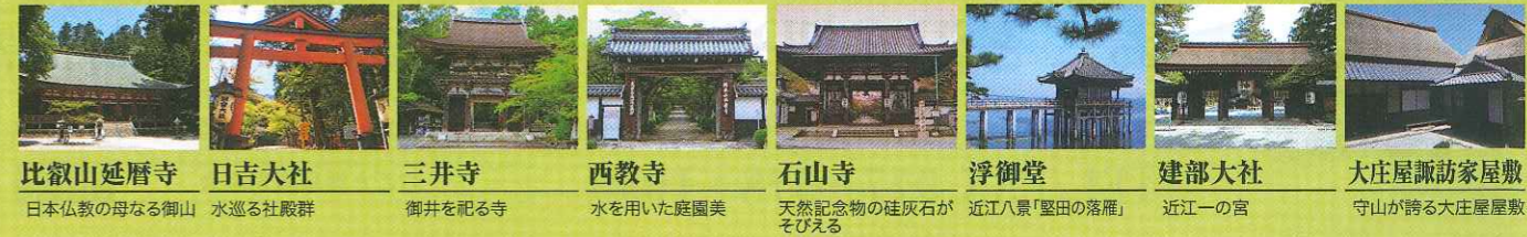
比叡山延暦寺 日本仏教の母なる御山 日吉大社 水巡る社殿群 三井寺 御井を祀る寺 西教寺 水を用いた庭園美 石山寺 天然記念物の礎灰石がそびえる 浮御堂 近江八景「堅田の落雁」 建部大社 近江一の宮 大庄屋諏訪家屋敷 守山が誇る大庄屋屋敷

琵琶湖を中心に広まった信仰、その恵みにより育まれた暮らしの文化は、「琵琶湖とその水辺景観-祈りと暮らしの水遺産」として、平成27年に文化庁から「日本遺産」として認定されました。