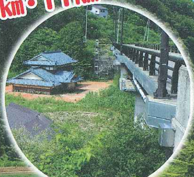
水没した家屋(木籠集落)