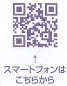
スマートフォンはこちら