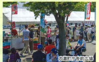
内灘町庁舎前広場