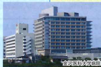
金沢医科大学病院