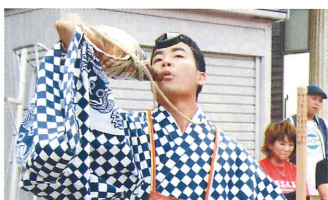
羽黒山伏のほら貝でスタート

昔からの修験道や石段、石畳は雨が乾きにくく、経年により表面が削れて滑り易い道が前半は続きます。滑り止めがあるトレッキングシューズやポールがあると安心安全です。