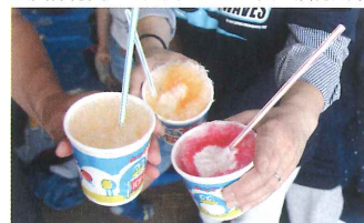
大人気! かき氷の給水