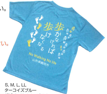
S, M, L, LL ターコイズブルー ※デザインはイメージです。

※電話・FAX・メールによる「予約」は受付いたしません。9/1(土)以降のお申込は、大会当日にお申込ください。