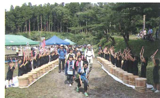
大山保育園児の元気いっぱい歓迎酒樽太鼓