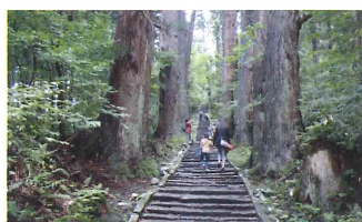
2446段の石段と杉並木