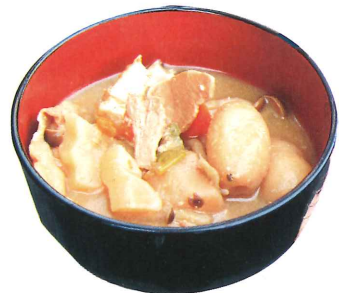
おふるまい「庄内風芋煮汁」

昔からの修験道や石段、石畳は雨が乾きにくく、経年により表面が削れて滑り易い道が前半は続きます。滑り止めがあるトレッキングシューズやポールがあると安心安全です。