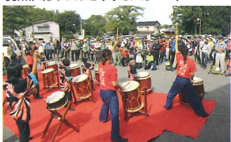
勇壮な羽黒太鼓こどもクラブの演奏の中スタート