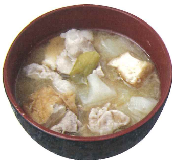
おふるまい「庄内豚の豚汁」

江戸時代、幕府天領として造り酒屋が軒を連ねていた酒蔵のまち大山。ラムサール条約登録湿地「上池・下池」、ブナ林が美しい高館山自然休養林や龍神様をまつる善賢寺をめぐり歩きます。