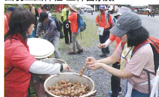
名物 玉こんにゃくの給水