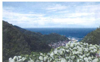
第19代首相・原敬記念碑から臨む加茂港