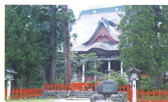
出羽三山神社 三神合祭殿