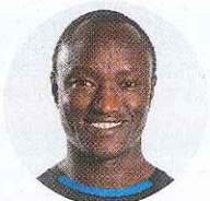
【ゲストランナー】 エリック・ワイナイナ