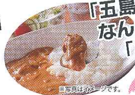
写真真似イメージです。

大会2日目の昼食は 「五島の鯛で出汁をとった なんにでもあうカレー」と 「お楽しみ抽選会」 もあります。