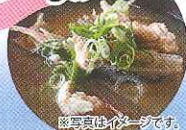
写真真似イメージです。

大会1日目の昼食は 「アラ汁とお刺身に奈留弁当」 「お楽しみ抽選会」 もあります。