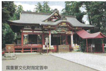
おおさきじんじや 大前神社

1500年有余の歴史を誇る延喜式内の名社。祭神は福の神様のだいこく様とえびす様。金運招福、商売繁盛を願って多くの参拝客で賑わっています。安土桃山時代末期に造られた、極彩色の彫刻が見事な御本殿も必見。