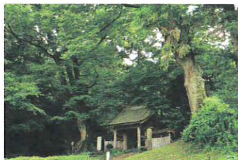
ひつしょうじ 仏生寺

かつて江戸で大変な人気を誇ったという真岡もめん。この地では昔、農閑期の仕事として多くの農家女性たちが機織りにいそぎました。木綿会館はその伝統を今に伝える施設で、機織の見学や染色体験もできます。