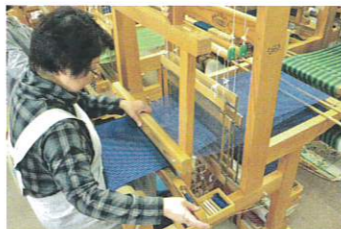
もめんかしかん 木綿会館

1500年有余の歴史を誇る延喜式内の名社。祭神は福の神様のだいこく様とえびす様。金運招福、商売繁盛を願って多くの参拝客で賑わっています。安土桃山時代末期に造られた、極彩色の彫刻が見事な御本殿も必見。