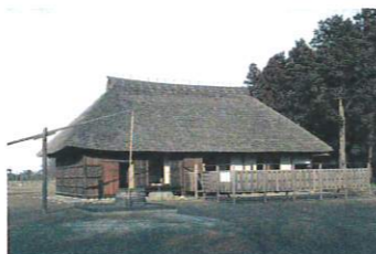
さくらまちじんや 桜町陣屋

日光を開山した勝道上人誕生の地と伝わる仏生寺。境内には勝道上人の産湯に使ったとされる乳母井戸があります。境内は「日光開山勝道上人誕生地」として県指定史跡に。山門の大ケヤキは県指定天然記念物です。