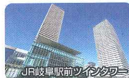
JR岐阜駅前ツインタワ