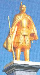
黄金の織田信長像