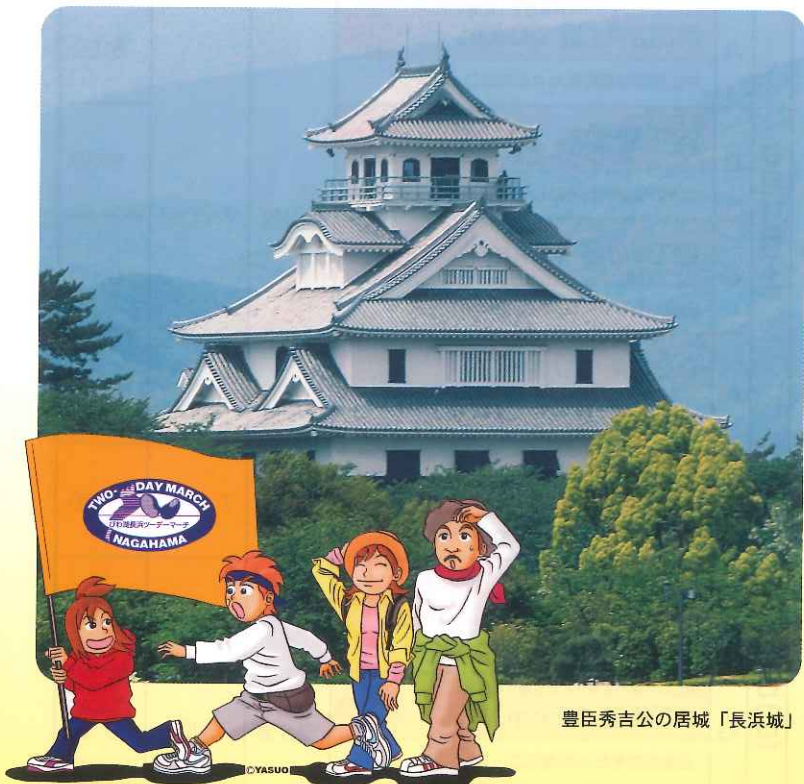
豊臣秀吉公の居城「長浜城」

主催 長浜市 長浜市教育委員会 (公財)長浜文化スポーツ振興事業団 (一社)日本ウォーキング協会 (特非)滋賀県ウォーキング協会 朝日新聞社 主管 びわ湖長浜ツデーマーチ実行委員会 後援 滋賀県教育委員会 彦根市 米原市 (公財)滋賀県スポーツ協会 びわ湖放送 (一社)全日本ノルディック・ウォーク連盟