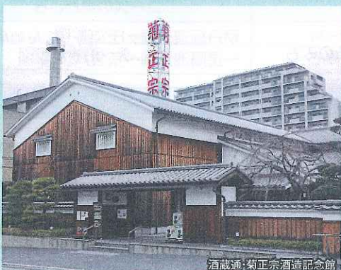
酒蔵通・菊正宗酒造記念館