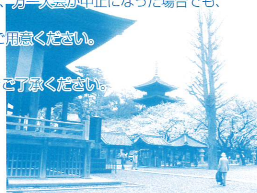
桜の中山法華経寺