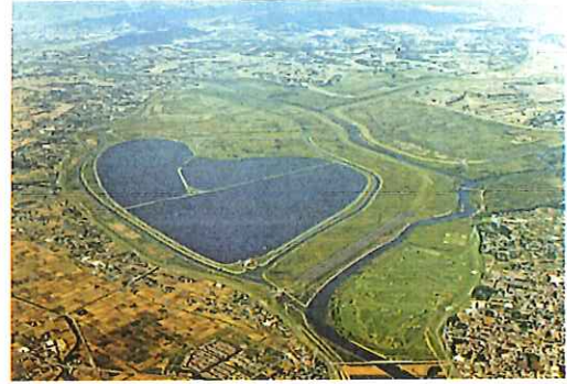
日本一大きなハートの谷中湖 (渡良瀬遊水地)