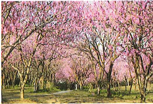
1,500本のはなももが咲き乱れる古河桃まつり (古河公方公園)